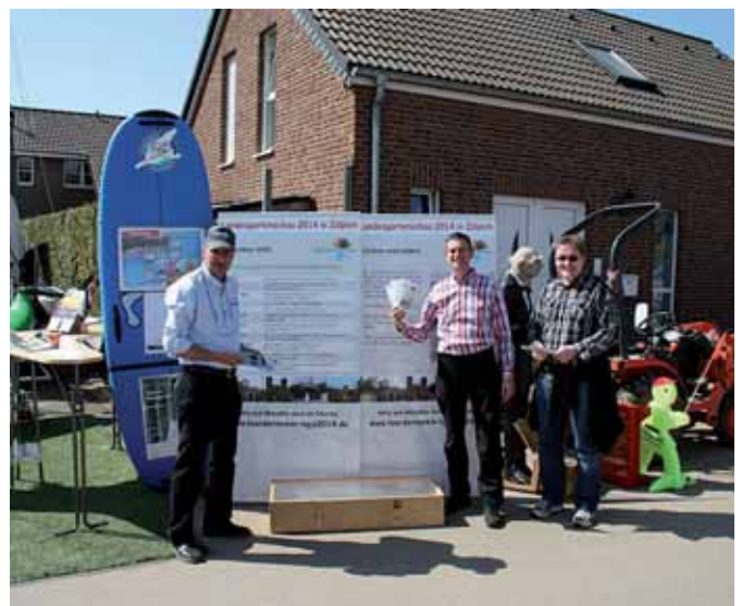
Infostand des Fördervereins auf der Frühjahrmesse der Baumschule Schmitz

Nicht nur dabei sondern mittendrin. So lautete das Motto des Fördervereins der LAGA 2014 am 17./18. April 2010. Bei strahlendem Sonnenschein nutzte der Förderverein die Gunst der Stunde, um zeitgleich bei zwei Veranstaltungen auf sich aufmerksam zu machen. Beim Tag der offenen Tür der Firma Schmitz in Ülpenich bezog der neugestaltete Stand des Fördervereins Position und es wurden fleißig Flyer verteilt, um neue Mitglieder zu werben und natürlich auch um auf die Baumpatenschaftsaktion aufmerksam zu machen. Unterstützung wurde auch wieder durch Pantao geboten, der auf Stelzen gehend die Besucher begeisterte. Und auch der Stand beim Chlodwiglauf wurde rege frequentiert. Der Förderverein sucht weiterhin Interessierte, die sich in verschiedenen Arbeitsgruppen engagieren möchten. Mehr Infos unter www.foerdereverein-laga2014.de .